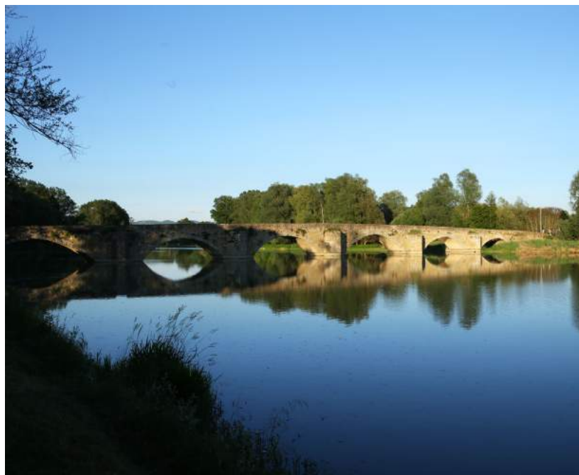
Ponte a Buriano