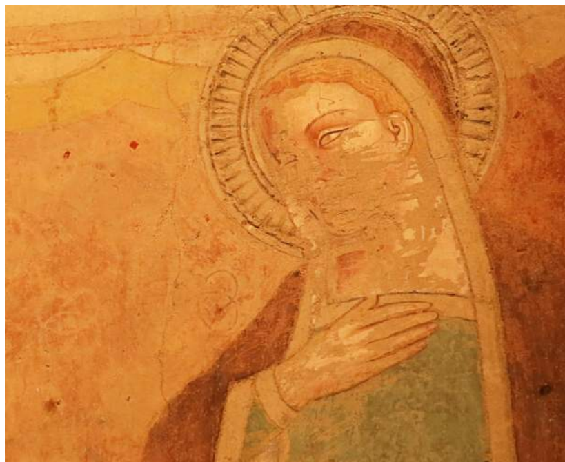
Immagini di repertorio