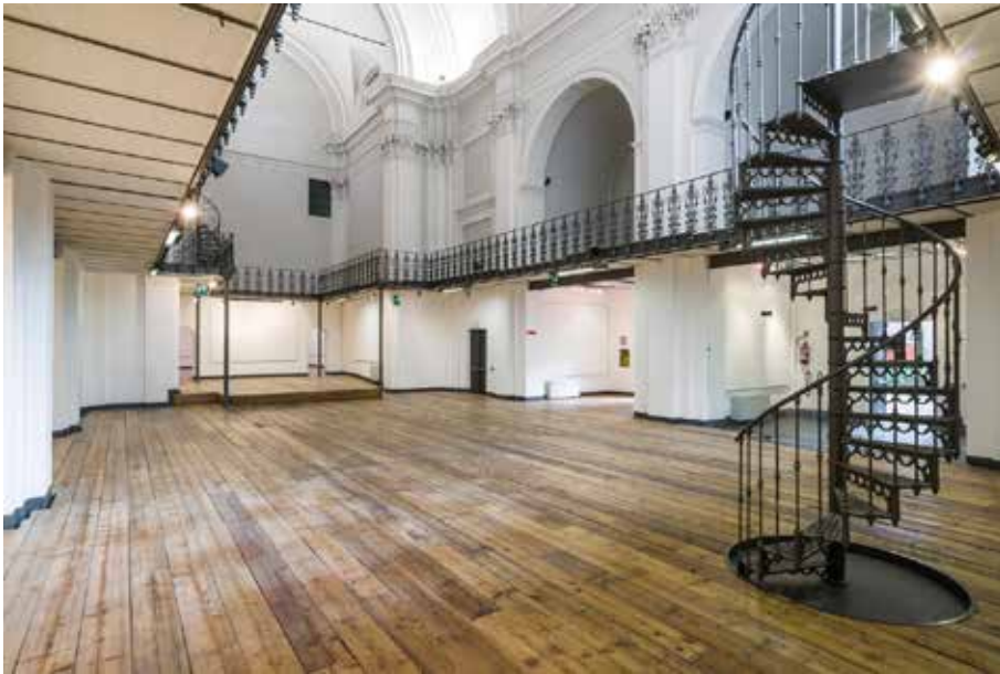
view of the central nave and of the stage