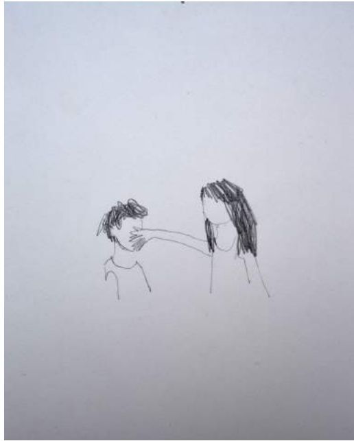
Misticanza 2014 matita su carta 21 x 15 cm