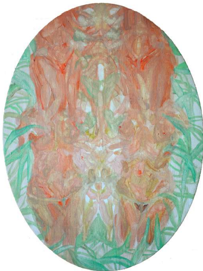
Caleido 2015 olio su tela 35 x 30 cm