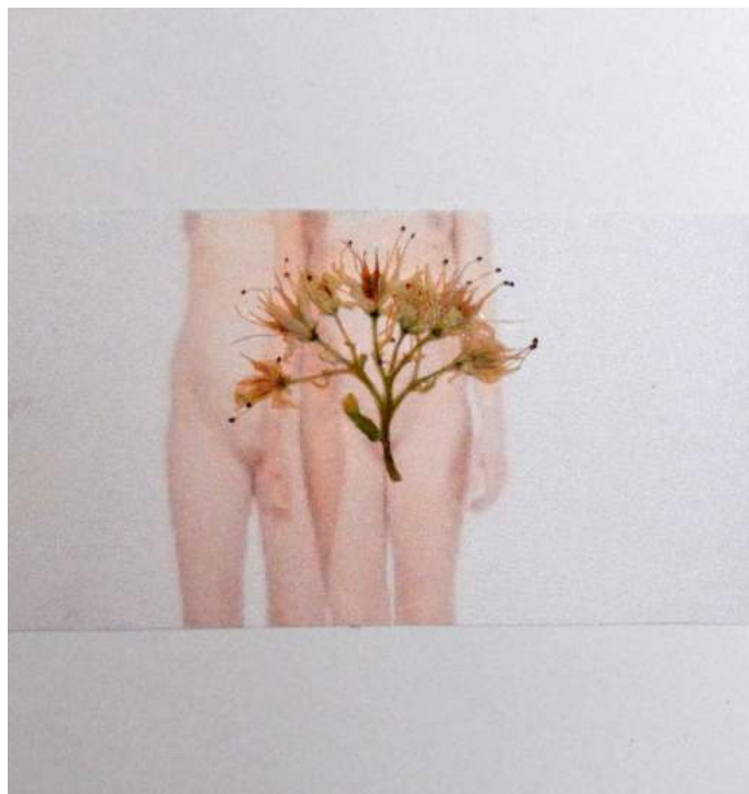
Le litanie 2015 tecnica mista su carta 13 x 13 cm