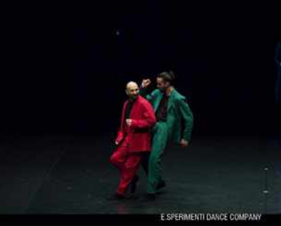
E.SPERIMENTI DANCE COMPANY