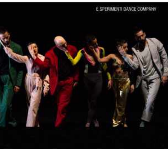
E.SPERIMENTI DANCE COMPANY