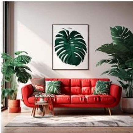
"A living room with a red couch and monstera plants"