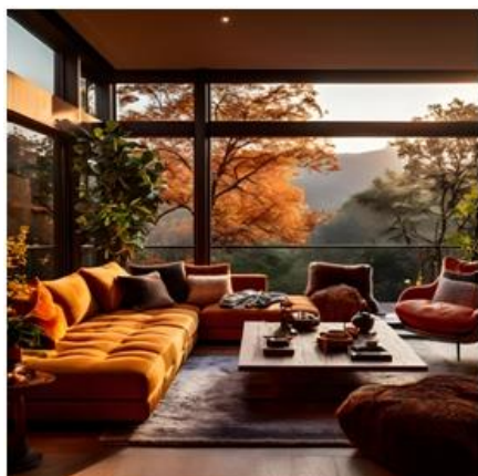
"A living room, warm colors"