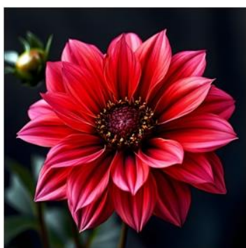
"A realistic flower"