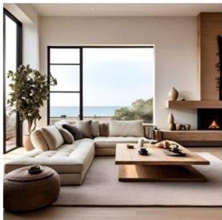
"A living room"